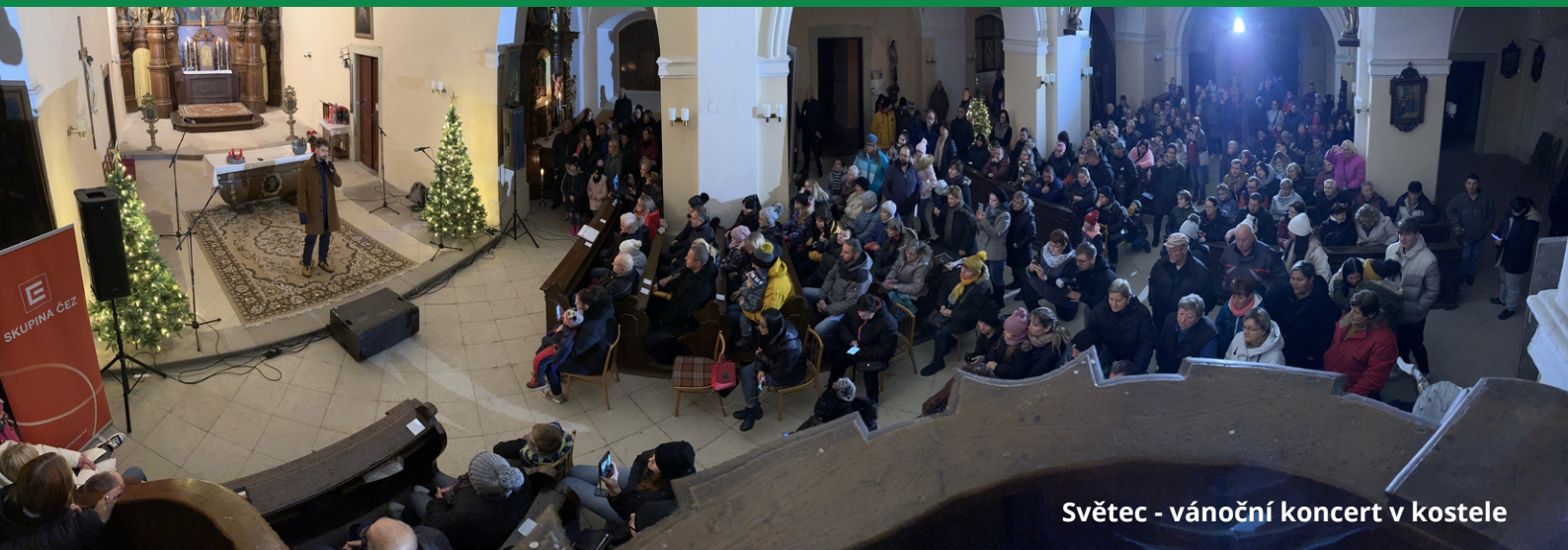
Světec - vánoční koncert v kostele