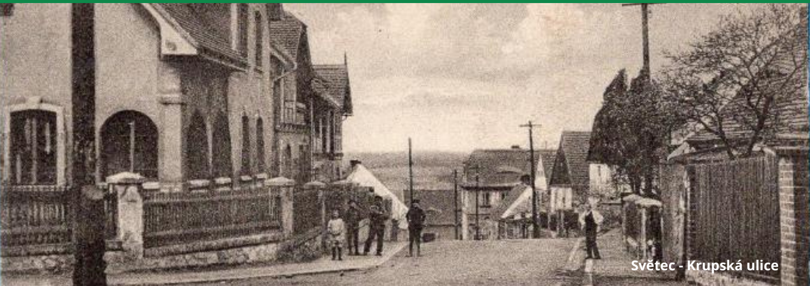
Světec - Krupská ulice