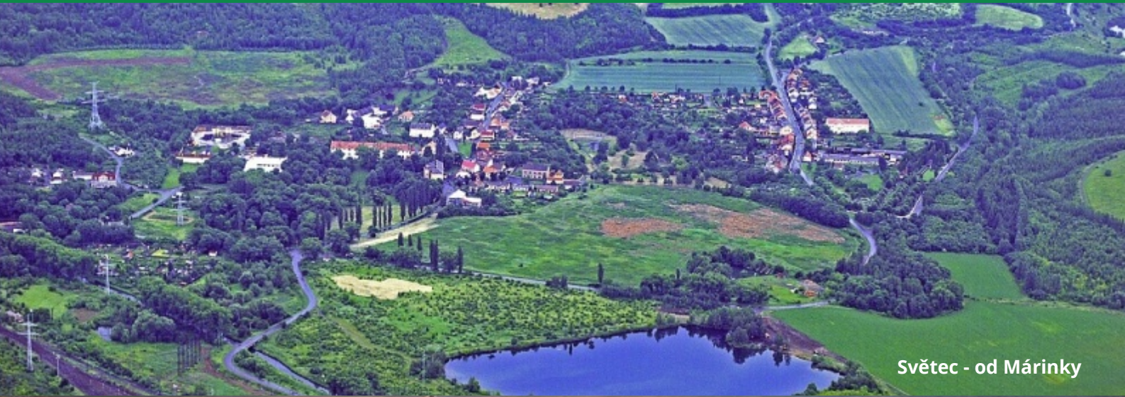
Světec - od Mářinky