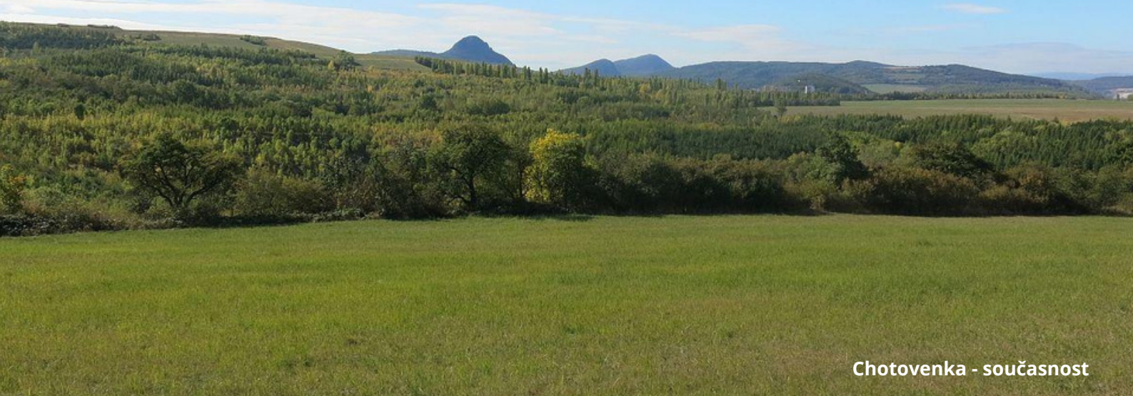
Chotovenka - současnost