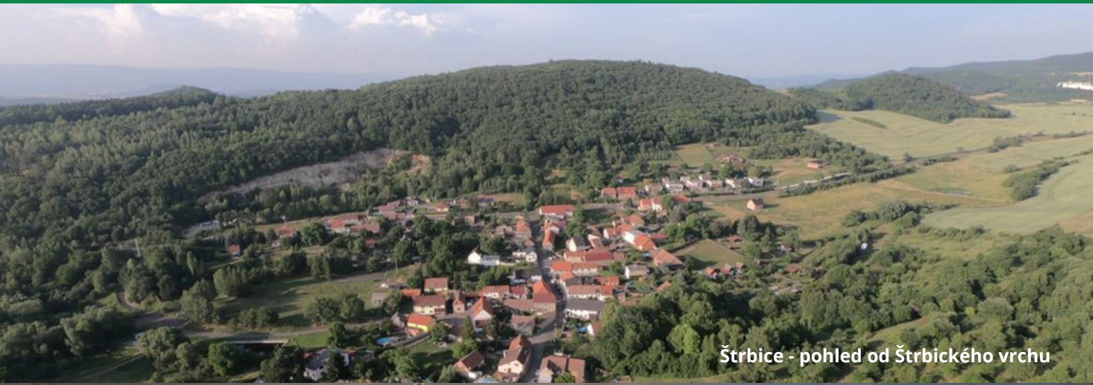
Štrbice - pohled od Štrbického vrchu