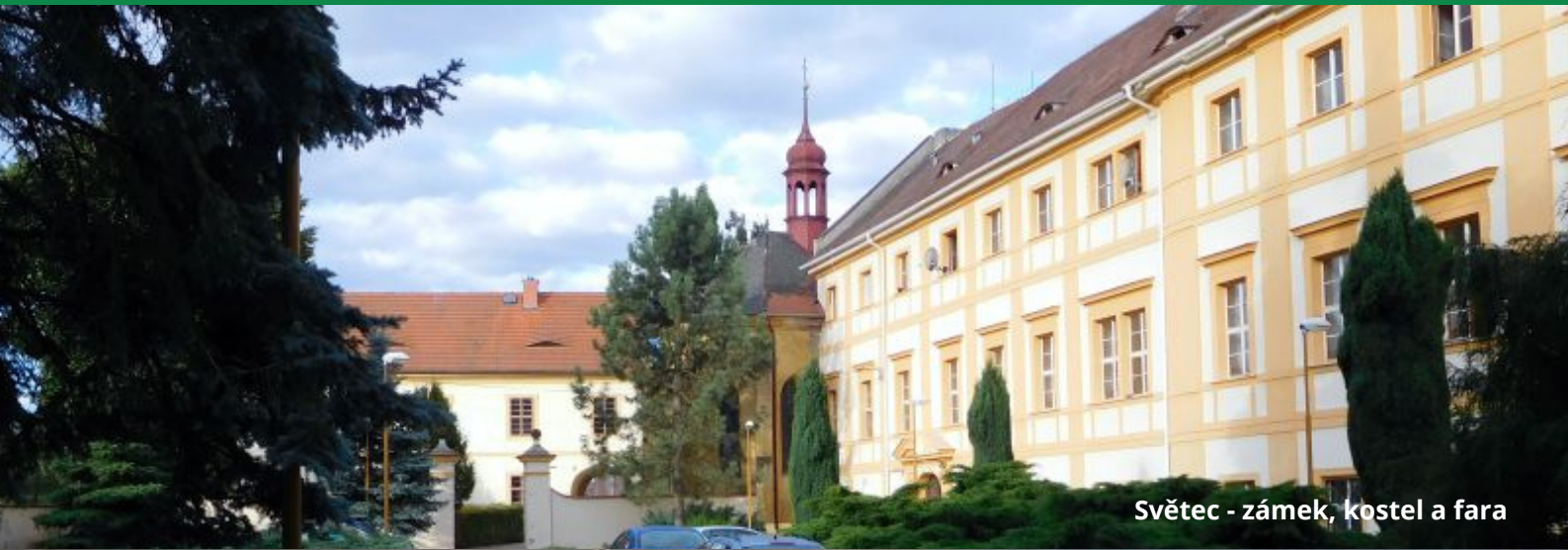
Světec - zámek, kostel a fara