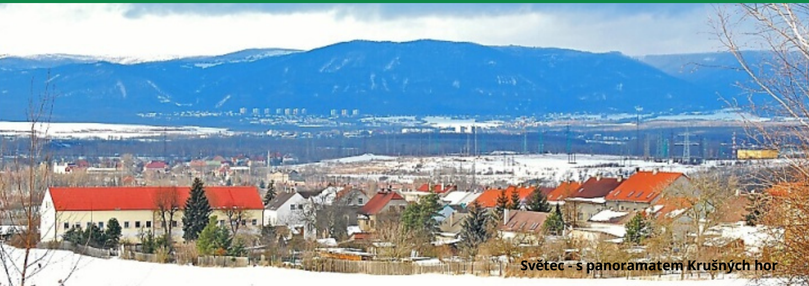
Světec - s panoramatem Krušných hor