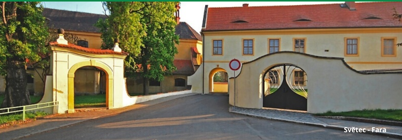
Světec - Fara

VÁŽENÍ OBČANÉ, DOVOLTE NÁM, ABYCHOM VÁM DO ROKU 2024 POPŘALI MNOHO ZDRAVÍ, ŠTĚSTÍ, KLIDU, SPOKOJENOSTI A POHODY. VĚŘÍME, ŽE LETOŠNÍ ROK BUDE PRO NÁS VŠECHNY ÚSPĚŠNÝ.