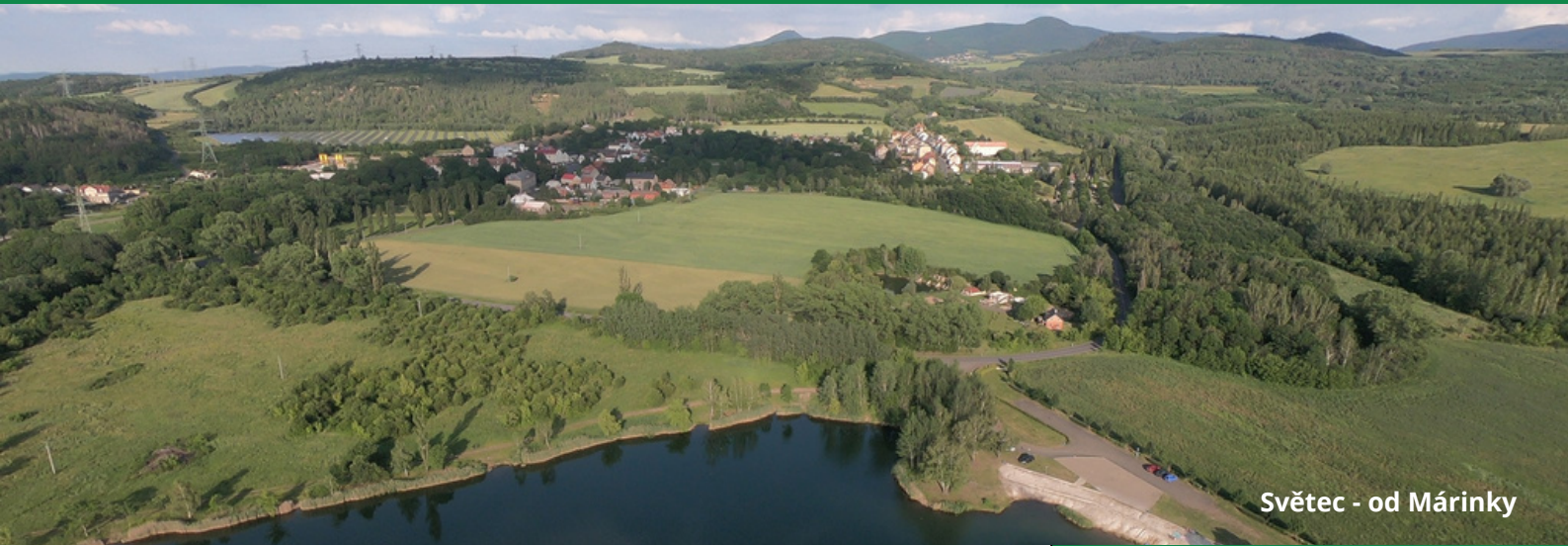
Světec - od Mářinky