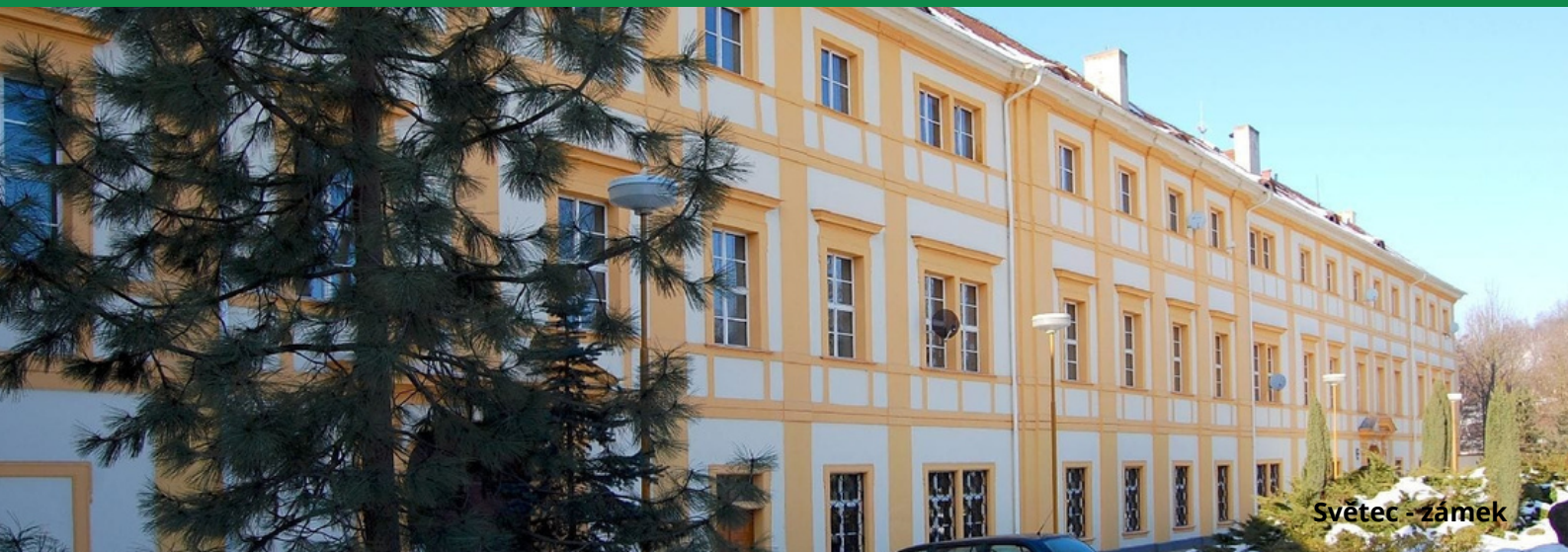
Světec - zámek